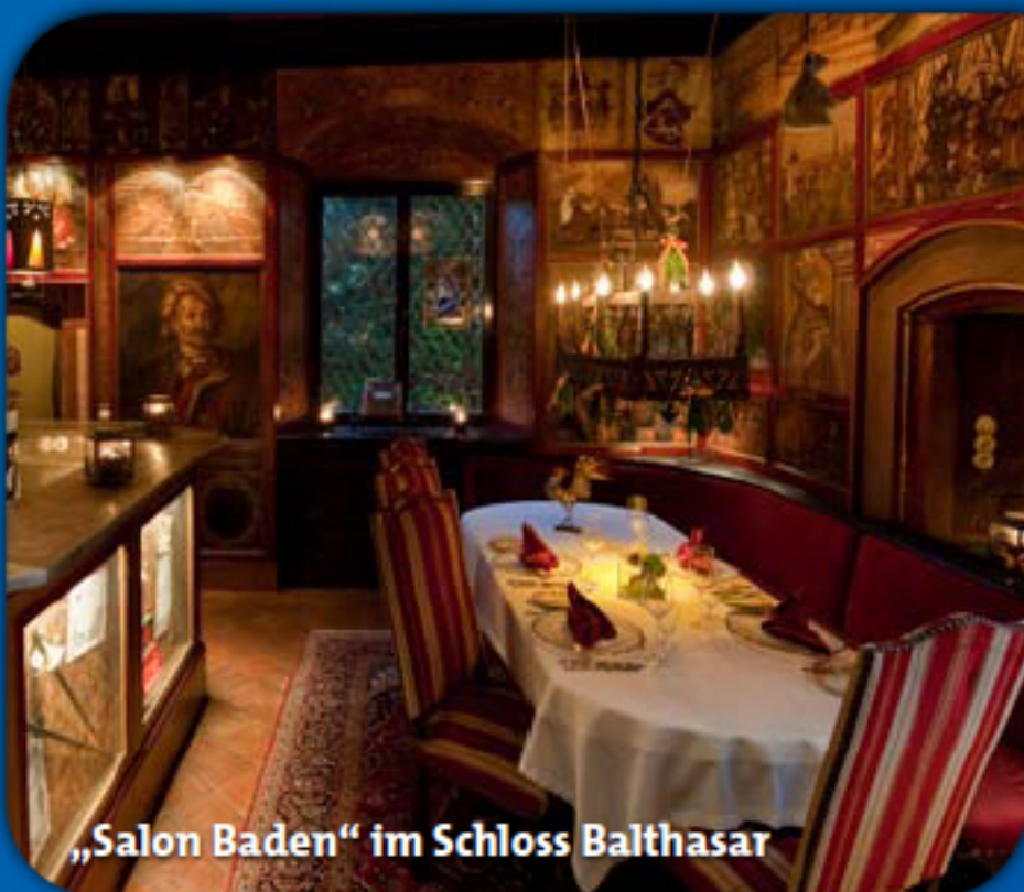
„Salon Baden“ im Schloss Balthasar

Die Eintrittskarte für den Besuch des Europa-Park am Nachmittag erhalten Sie ab 12:45 Uhr desselben Tages an der Information am Haupteingang – nach dem großen Ansturm am Morgen.